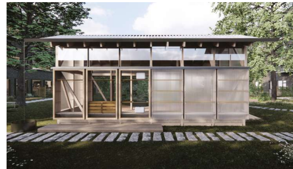
Udestuens bagside, hvor indbyggede funktioner også kan tilgås.

Mødestederne har det samme tag og ligner hinanden som konstruktion. Alligevel er de forskellige og har hver deres muligheder. Variationen opstår, fordi mødestederne er beklædt med forskellige materialer og nogle har åbn, mens andre har lukkede facader. De indbyggede funktioner som skabe, reoler, bænke og vask varierer også fra mødested til mødested. Og så indretter I jer naturligvis lige præcis, som I vil. Der er fire forskellige mødesteder, men de kan bruges på hundredvis af forskellige måder.