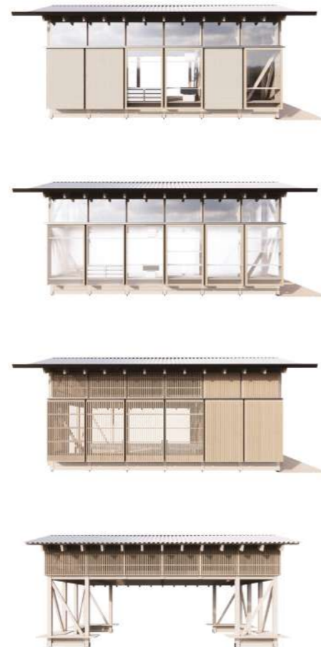
Mødestederne bygger på samme konstruktion, men adskiller sig fra hinanden i udtryk, materialer og indbyggede funktioner.

De fire mødesteder er tegnet i fællesskab af arkitekt- og designvirksomhederne Cobe, Reværk, Archival Studies, Pihlmann Architects, Rumgehør og Studio XYZ. Arkitekternes tanke har været at skabe en enkel og inviterende arkitektur. Det velkendte saddeltag gør, at mødestederne passer ind rigtig mange steder. Det store tagudhæng skaber ly og indbyder til at slå sig ned. Væggene har transparente skydedøre, der kan åbnes op, så man kan lave aktiviteter både indenfor og udenfor. Mødestederne er ikke opvarmede, men giver læ og ly. De er tænkt til et liv med årstiderne og om efteråret tager man en ekstra sweater på.